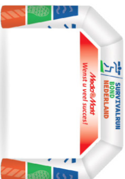
Doek onder opblaasboog

💡 Na het evenement kan het materiaal uiteraard worden bewaard voor de volgende run.