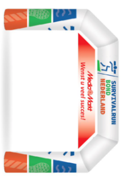
Doek onder opblaasboog

A) Vraag via secretaris@survivalrunbond.nl eenvoudig het template op en plaats hierin de logo's van de sponsoren.